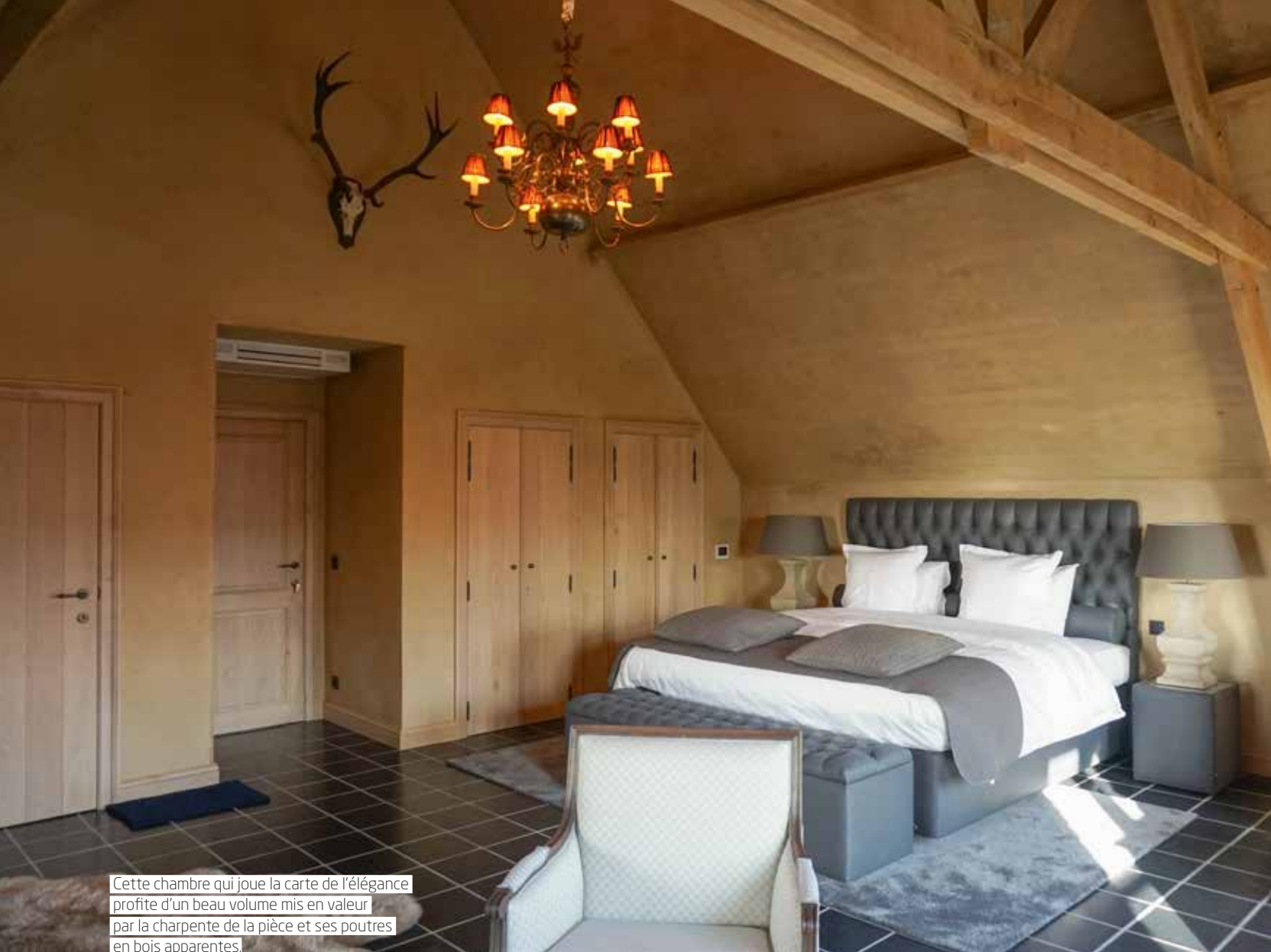
Cette chambre qui joue la carte de l'élégance profite d'un beau volume mis en valeur par la charpente de la pièce et ses poutres en bois apparentes.