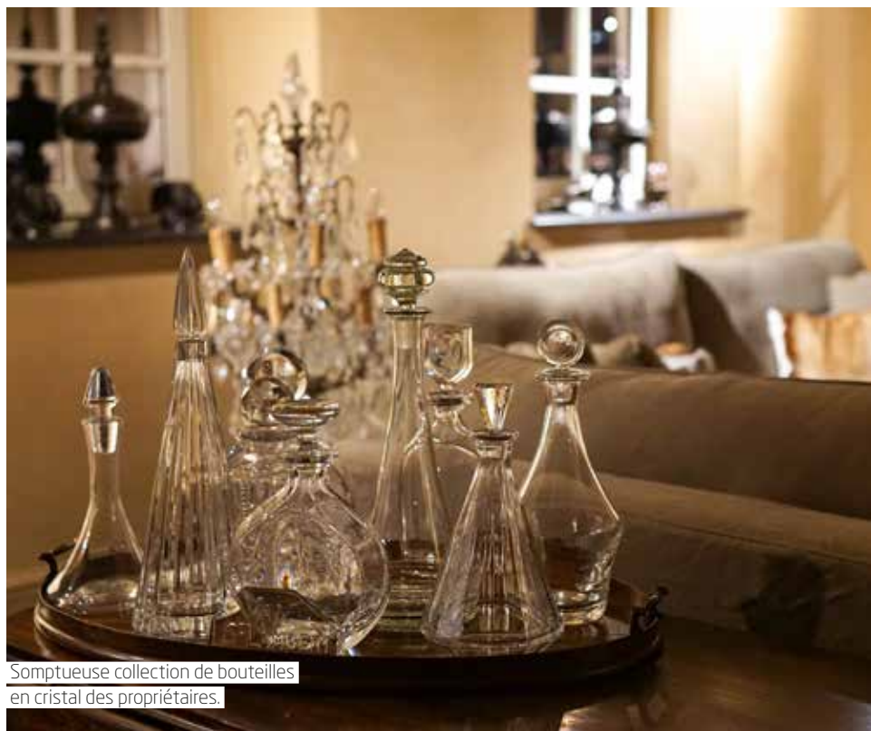
Somptueuse collection de bouteilles en cristal des propriétaires.