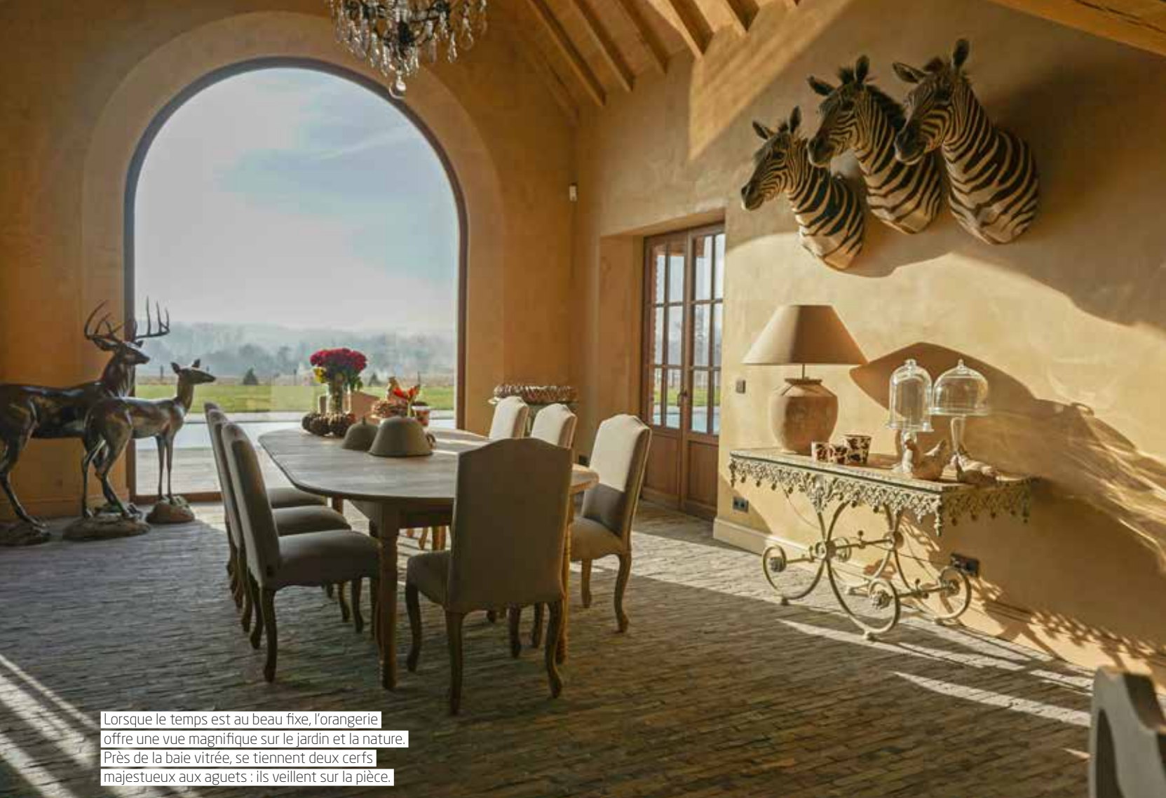
Lorsque le temps est au beau fixe, l'orangerie offre une vue magnifique sur le jardin et la nature. Près de la baie vitrée, se tiennent deux cerfs majestueux aux aguets : ils veillent sur la pièce.