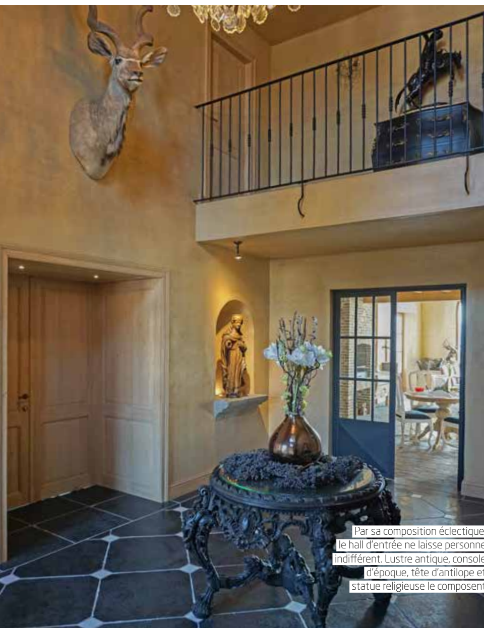
Par sa composition éclectique, le hall d'entrée ne laisse personne indifférent. Lustre antique, console d'époque, tête d'antilope et statue religieuse le composent